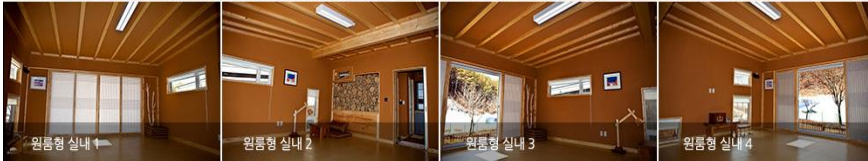
원룸형 실내 1