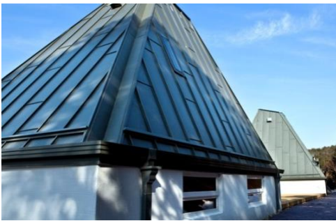
[ 피라미드 - 빛채, 빛마루 : 4인용 ]