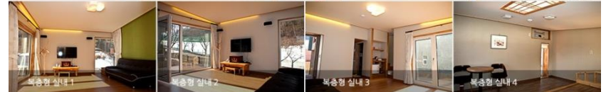
복층형 실내 1